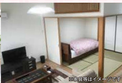
※家具等はイメージです