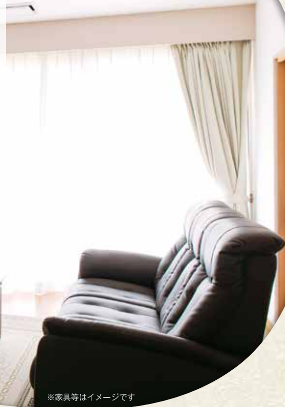
※家具等はイメージです