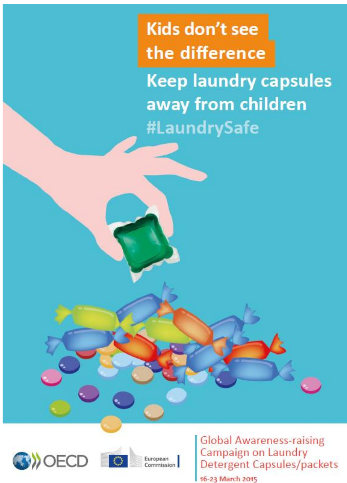
図. OECD「洗濯洗剤カプセル／パケットに関する国際啓発キャンペーン」ポスター (注10)