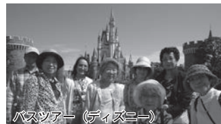
バスツアー (ディズニー)