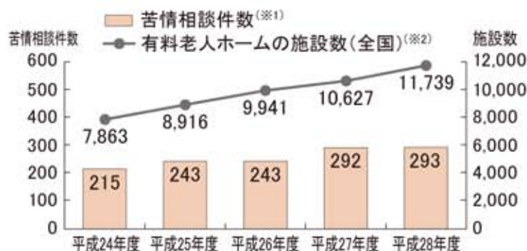
グラフ1 有料老人ホームの施設数と当協会に寄せられた苦情相談件数の推移

相談者は、本人よりも家族が多く、家族からの相談は増加傾向にあります。また、自治体や消費生活センターの相談員からも相談が寄せられています。 年々、当協会に登録していないホームや登録の有無が不明なホームを対象とする相談が増えており、本協会の「活動」が、消費者に広く認知・利用されていることが